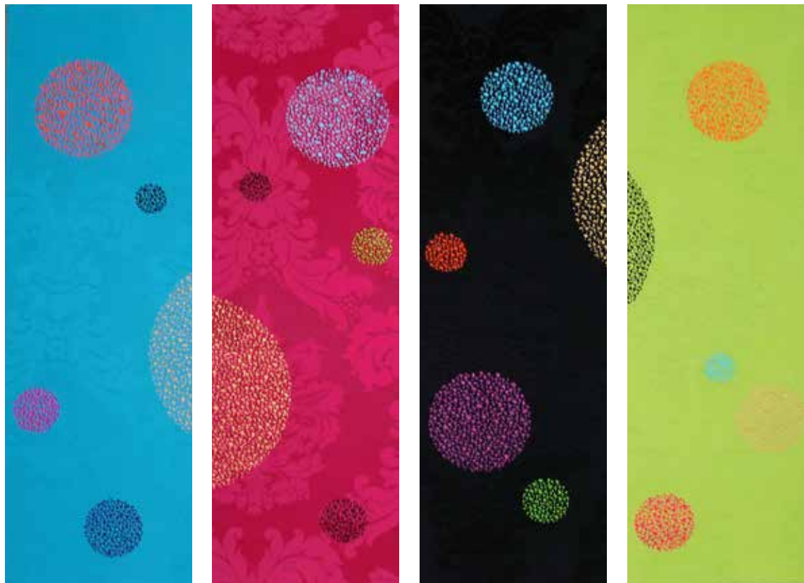
Allumer les étoiles V - 2009 - 60x20 cm - Acrilico su tela