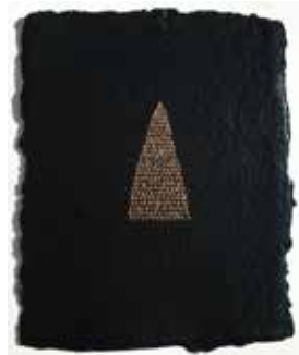
Je viens de la Montagne - 2002 - 28x22 cm - acrilico su carta