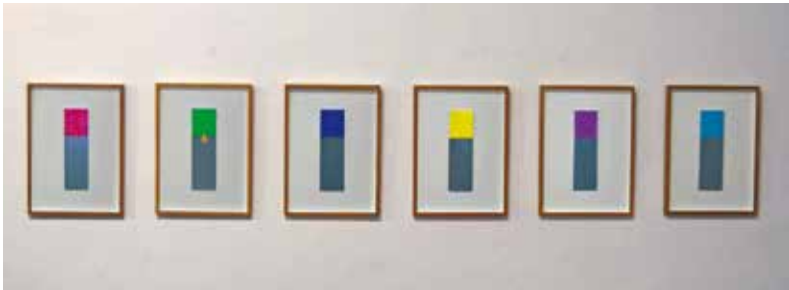
Gris Limite - 2001 - 25x7cm - Acrilico su carta