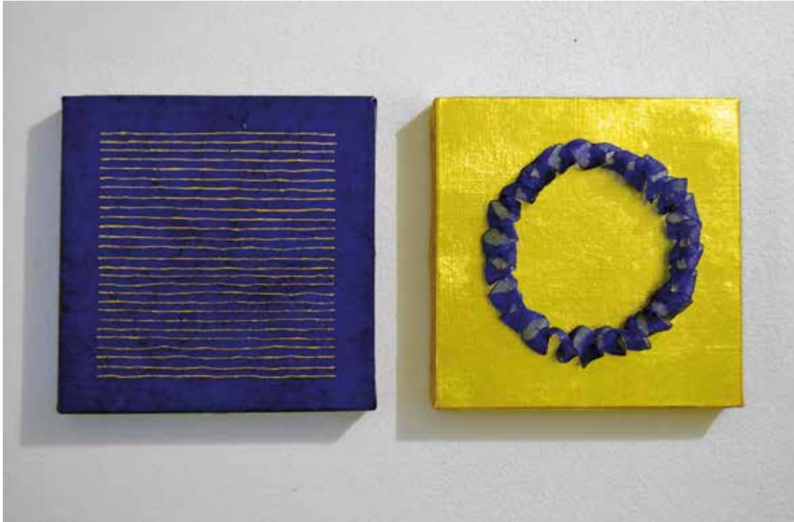
Poser le Vent - 2013 - 20x20 cm - Acrilico su tela