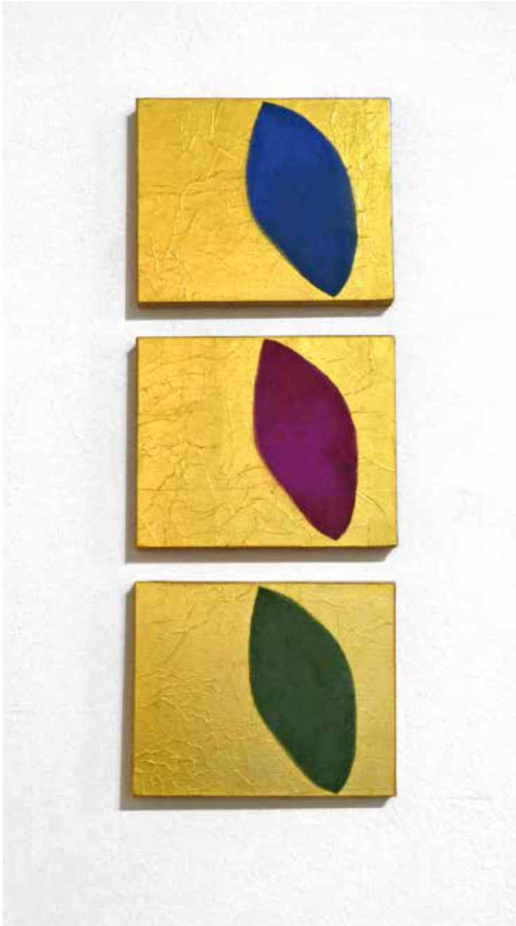
Migaru XIII - 2013 - 22x27cm - Organdi su oro