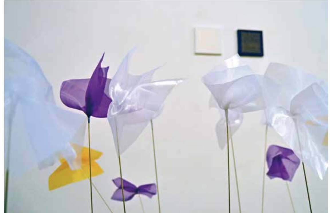
Val d'Organdi - 2013 - H 100 cm - Organdi su metallo