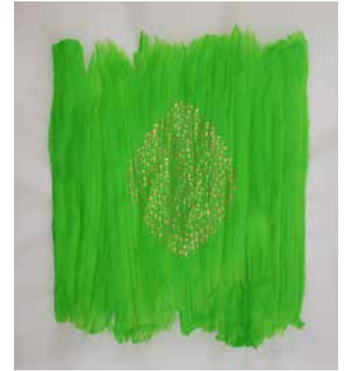
Trame Fleuve - 2001 - 40x34 - Acrilico su lucido